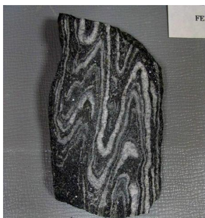
Фото. Железистый кварцит.

ЗАДАНИЕ 1. Перед Вами фотография образца железистого кварцита (фото). Назовите текстуру руды и какими факторами были обусловлены такие текстурные особенности образца?